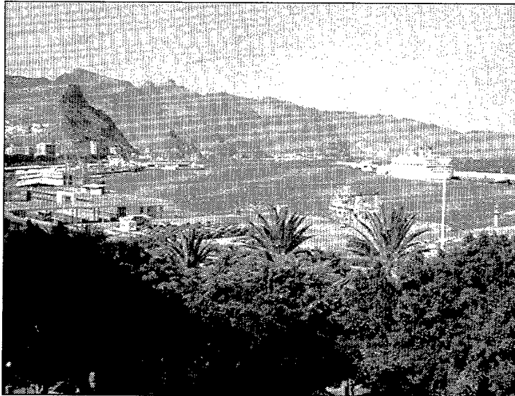
Panorámica del puerto de Santa Cruz de Tenerife

En lo que al puerto de Santa Cruz de Tenerife se refiere, el aumento fue el menos significativo de los cinco puertos que engloba la provincia, aunque sumó el 72,2%, con 1,06 millones de pasajeros. Sin embargo, 1997 no fue el mejor año de la década en la capital tinerfeña, ya que la cifra de dicho período fue superada en los años 1995 y 1996, en los que se