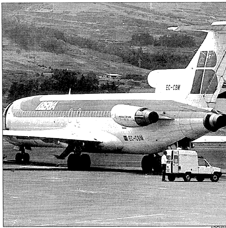
El alza de los precios en Iberia fue del 21,8%