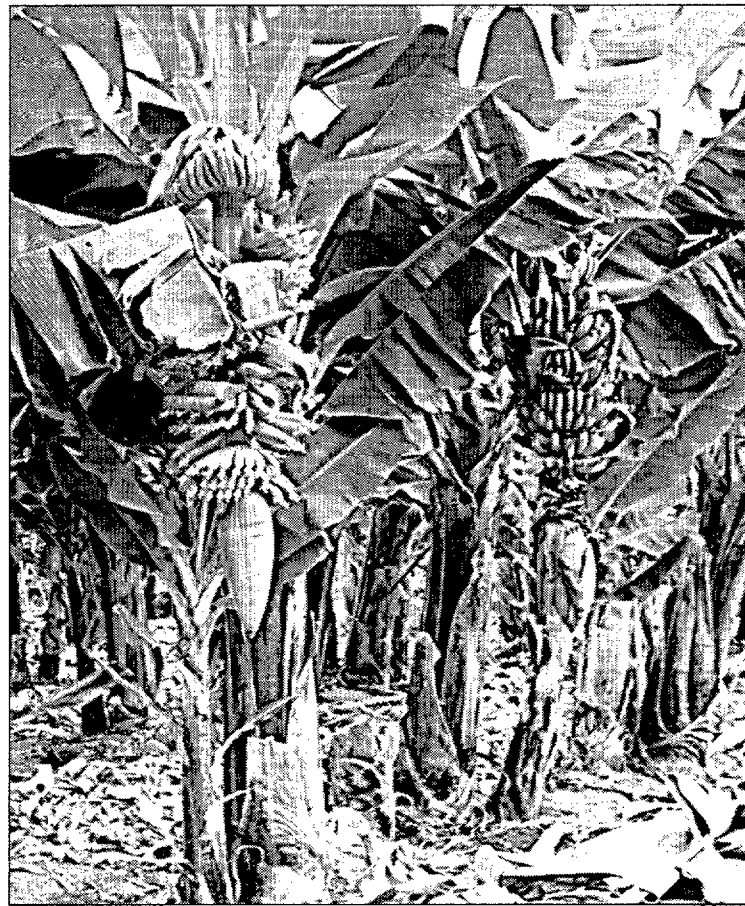
Finca dedicada al cultivo del plátano en Tenerife

cantes de Cigarrillos y Cigarros de Canarias y la Compañía Canariense de Tabacos. En la sentencia, que no puede ser recurrida, el Tribunal de Defensa de la Competencia resuelve «intimar a Tabacalera, SA para que, en el futuro se abstenga de realizar tales prácticas» y ordena la publicación de esta resolución en el Boletín Oficial del Estado (BOE). ■