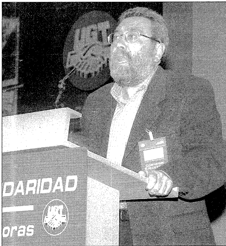
Cándido Méndez, ayer, en su intervención en el XXXVII Congreso de UGT

Los esfuerzos de la central se encaminarán hacia el pleno empleo, con una redistribución justa de la bonanza económica y atención especial a colectivos «que no disponen de medios para la defensa de sus legítimos intereses» como parados, pensionistas, jóvenes o mujeres. Y en esa actividad reivindicativa ocupará un